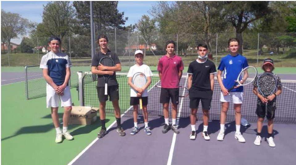
PLUSIEURS JOUEURS RÉUNIS LE TEMPS D'UNE PHOTO

Deux journées de matchs libres ont été organisées à l'initiative du BTC avec des clubs invités :